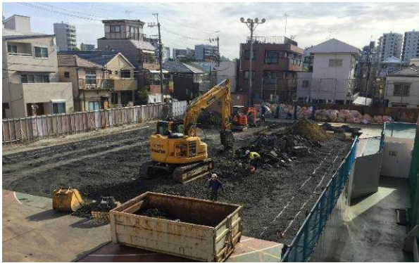
↑校庭に仮校舎を建設中

夏休みから大規模改修工事が始まり、体育館や校庭が使えない状況になって一か月が経ちました。体を動かして遊べないというのは子供たちにとってとても不自由を感じるのですが、子供たちは明るく元気に過ごしています。中休みや昼休みの過ごし方も、学年や学級で相談して上手に過ごしています。こんな時だからこそ、みんなで協力して仲良く学校生活を過ごしていこうという子供たちの前向きな気持ちが感じられ素晴らしいと思います。特に、高学年の子供たちは、学校のリーダーとして、規律を守り一日一日を大切に一生懸命に取り組んでいます。下級生のお手本